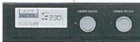
文字が見やすいホワイト液晶表示